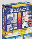
アプリケーションソフト 夢ぷりんと