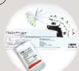
クリーニングキット ACLX